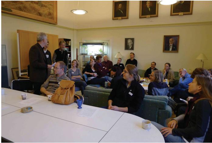
Figur 5. Hymenopteradagen 13 november 2011 drog många intresserade, här samlade i Entomologens lunchrum.

The Hymenoptera-day 13th of November 2011 attracted many enthusiasts, here gathered in the Entomology lunchroom, NRM.