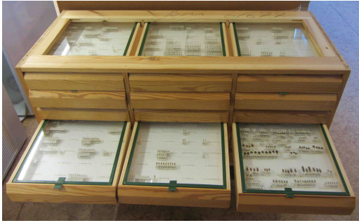
Figur 6. Huvuddelen av Jan Olssons svenska samling var organiserad i tre låga möbler vardera med 18 lådor. Fem av de sex synliga lådorna visar delar av Staphylinidae-samlingen.

The main part of Jan Olsson's Swedish Coleoptera collection was organized in three low standing furnitures, each with 18 drawers. Five of the six visible drawers show the Staphylinidae collection.