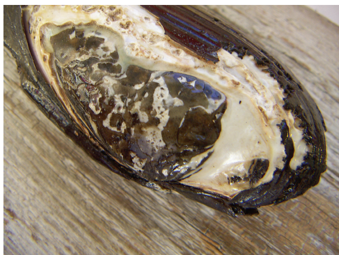
⚡ Kraftigt korroderad umbo (skalbuckla) på en äkta målarmussla.

Utbredning: Arten är relativt sällsynt och förekommer huvudsakligen i tre kärnområden: Skåne/södra Kronoberg, Emåsystemet (Småland) och ett större område omfattande Östergötland, Södermanland och Mälardalen. I västra Sverige är arten betydligt sällsyntare, men under senare år har en rad förekomster upptäckts, främst i Viskans, Ätrans och Suseåns vattensystem.