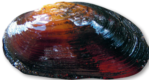
Flodpärlmussla ( Margaritifera margaritifera )

HOTKATEGORI: hotkategori LC (livskraftig) både nationellt och globalt (IUCN Red List).