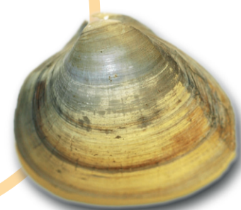
Amerikansk trågmussla ( Rangia cuneata )