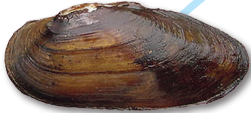
Äkta målarmussla ( Unio pictorum )

HOTKATEGORI: hotkategori NT (nära hotad) nationellt. Globalt klassad som LC, livskraftig (IUCN Red List).