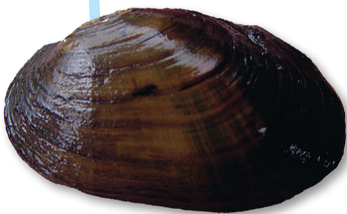
Tjockskalig målarmussla ( Unio crassus )

HOTKATEGORI: EN (Starkt hotad), både nationellt och globalt (IUCN Red List). Upptagen i EU:s art- och habitatdirektiv Natura 2000. Fridlyst i Sverige.