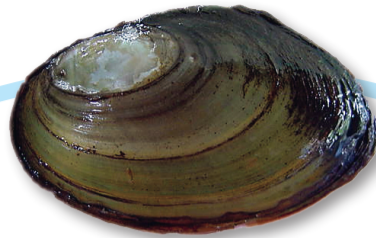
Flat dammussla ( Pseudanodonta complanata )

HOTKATEGORI: hotkategori NT (nära hotad) nationellt. Globalt klassad som LC, livskraftig (IUCN Red List).