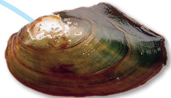
Allmän dammussla ( Anodonta anatina ; synonym A. piscinalis )

HOTKATEGORI: NT (nära hotad). Globalt klassad som VU, sårbar (IUCN Red List).