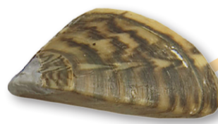
Vandrarmussla ( Dreissena polymorpha )

Främmande och invasiva arter som inte beaktas i nationell eller global rödlistning.