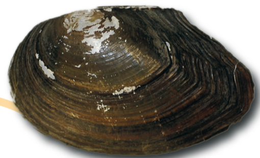
Kinesisk dammussla ( Sinanodonta woodiana )

HOTKATEGORI: LC (livskraftig) både nationellt och globalt (IUCN Red List).