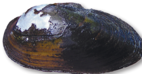
Spetsig målarmussla ( Unio tumidus )

HOTKATEGORI: LC (livskraftig) både nationellt och globalt (IUCN Red List).